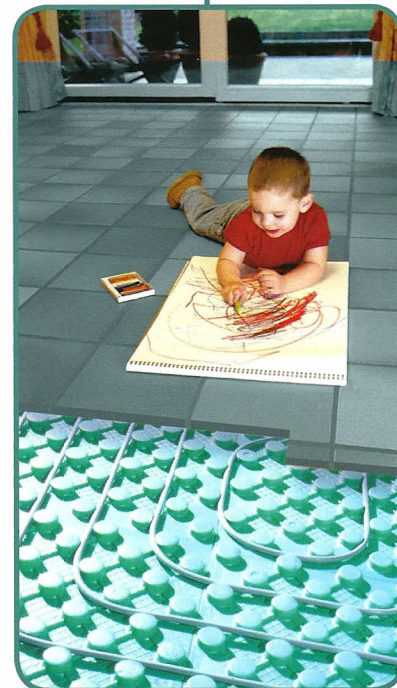
vloerverwarming - koeling